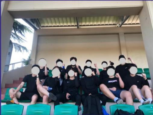
RA - ON

주기적으로모여축구나풋살을함께즐기며 과동기,선후배와함께운동장을뛰며 땀흘리고찬해지는시간을가질수있음