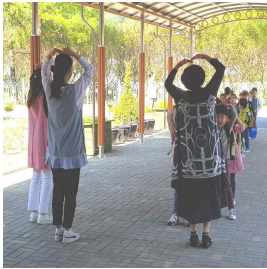
유아 등원 맞이