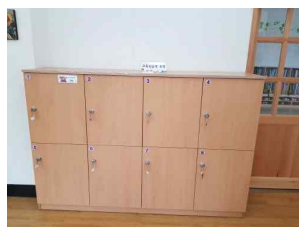
교육실습생 옷장 및 사물함