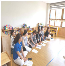
각 반 공개수업참관